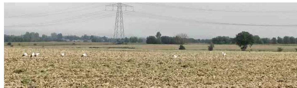
Avant de rejoindre des contrées plus chaudes, des cigognes ont fait une petite halte sur les terres d'Entraigues.