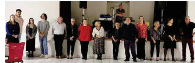
Membres de la Commission Sociale

Toute l'équipe de la Commission Sociale, élus, bénévoles et cette année quelques conscrits ont apprécié ce moment de convivialité et de partage et espèrent vous retrouver tous en cette nouvelle année.